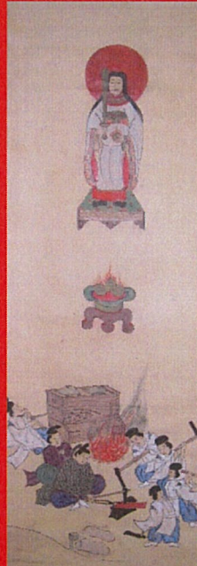
金屋子神の図（個人蔵）

日本最古級の今佐屋山製鉄遺跡から近世の福原製鉄遺跡・長源地2号製鉄遺跡など、邑南町には約530カ所の製鉄遺跡があります。