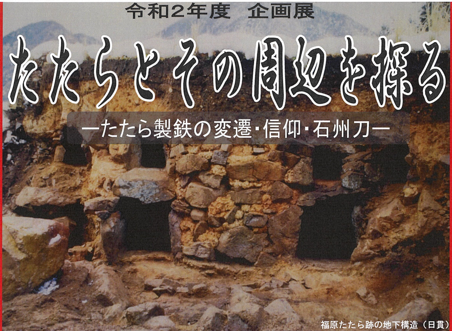
福原たたら跡の地下構造（日貫）